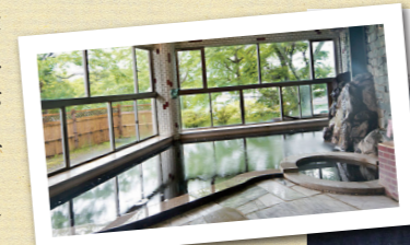
▲亀山温泉ホテルのチョコレート色の温泉

亀山湖は昭和55年に完成した亀山ダムによってできた人造湖です。四季折々に美しい表情を見せ、つり・サイクリング・ボート遊びなど多彩なレジャーが楽しめます。毎年8月には亀山湖上祭が開催され、約5000発の花火が空と湖面を彩る人気のイベントです。11月のオータムフェスティバルには10万人近い人達が、紅葉を楽しみにいらっしやいます。湖畔の当ホテルではチョコレート色の温泉も楽しんでいただけます。地域としてはいくつかの問題点があります。紅葉以外の観光、ご当地料理など食の充実、近隣の地域同様空家、空き地対