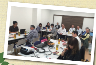
2016年5月18日、特別養護老人ホーム「夢の郷」にて行われた第103回セミナー。